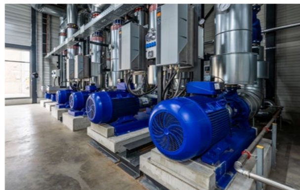
Zuverlässig und effizient: Pumpen von KSB in einem Biomassekraftwerk

Die Welt steht vor einer doppelten Herausforderung: Der Energiebedarf steigt kontinuierlich, während gleichzeitig der Klimaschutz höchste Priorität hat. Kraftwerke spielen dabei eine zentrale Rolle. Mit seinen Pumpen, Armaturen und Serviceleistungen sorgt KSB für den zuverlässigen und effizienten Betrieb von allen Arten von Kraftwerken.