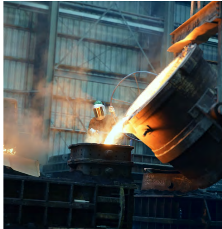
Produktionswerk in Grovetown, Georgia

KSB verfolgt ehrgeizige Klimaziele und setzt entsprechende Maßnahmen um. Wie das an einem der weltweit 37 Produktionsstandorte aussieht, zeigt das Beispiel von Grovetown in den USA.