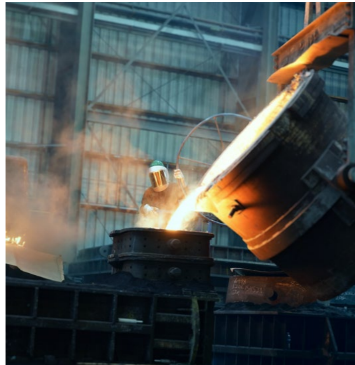
Produktionswerk in Grovetown, Georgia

KSB verfolgt ehrgeizige Klimaziele und setzt entsprechende Maßnahmen um. Wie das an einem der weltweit 37 Produktionsstandorte aussieht, zeigt das Beispiel von Grovetown in den USA.