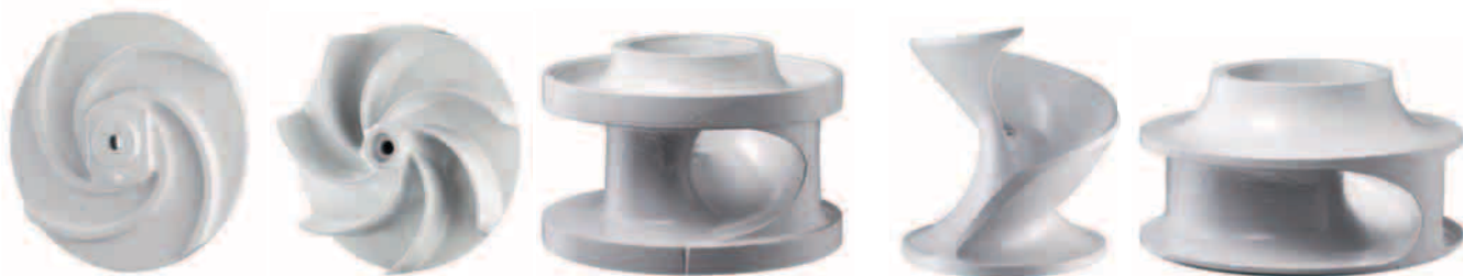
Wirniki typu: S, F, E, D, K

Własności pompowanej cieczy narzucają konieczność zastosowania pompy z odpowiednim do nich wirnikiem. Należy zauważyć, że nie istnieje jedno rozwiązanie uniwersalne, każdy rodzaj ścieków wymaga rozwiązania specyficznego! Stosowanie wirnika z urządzeniem rozdrabniającym (S) ma sens tylko wtedy, gdy projektujemy rurociągi tłoczne o małych średnicach. Rozpowszechnione wcześniej poglądy o wyjątkowych zaletach tego typu wirników należy zrewidować. W realiach naszego kraju ścieki niosą w sobie zbyt dużą zawartość zanieczyszczeń stałych (piasek, popiół, elementy długowłókniste, itp.), które wpływają na szybsze zużycie elementów tnących wirnika. Wirniki o swobodnym przepływie (F) są szczególnie polecane do pompowania ścieków surowych, osadów i szlamów. Odpowiednio do zawartości w ściekach ciał stałych i gazów można stosować wirniki zamknięte jedno – (E) lub wielopłatkowe (K). Dla ścieków o dużej zawartości ciał stałych