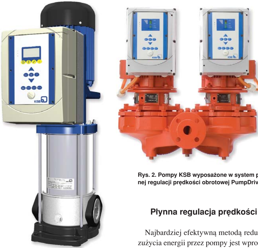
Rys. 2. Pompy KSB wyposażone w system płynnej regulacji prędkości obrotowej PumpDrive