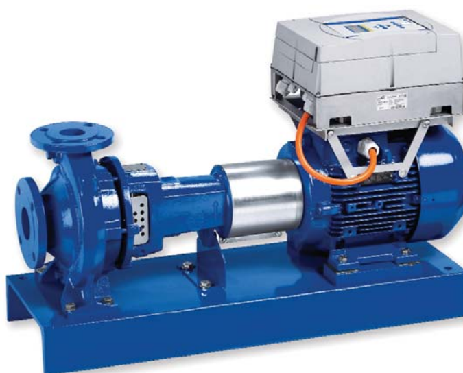
Rys. 1. Pompy KSB wyposażone w system płynnej regulacji prędkości obrotowej PumpDrive