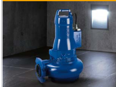
Ama-Drainer Box podúrovňový