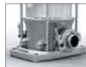
Příruba Tricamp Movitec V(S)T