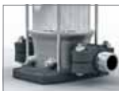
Příruba Victaulic Movitec V(S)V