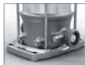
Připojení vnějším závitem Movitec VE