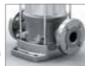
Kruhová příruba Movitec VSF