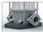
Oválná příruba Movitec VS