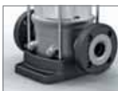
Kruhová příruba Movitec VF