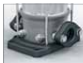
Oválná příruba Movitec V