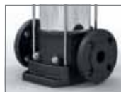
Kruhová příruba Movitec VCF